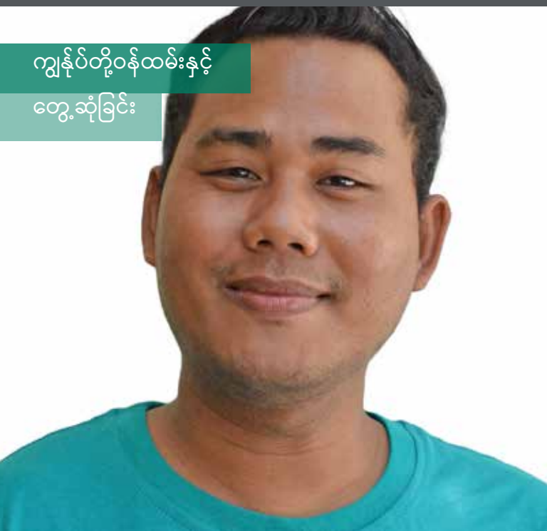
ကျွန်ုပ်တို့ဝန်ထမ်းနှင့် တွေ့ဆုံခြင်း

လတ်တလောအခြေအနေအရ ယခုကဏ္ဍသည် ဖော်ပြ၍မရပါ။